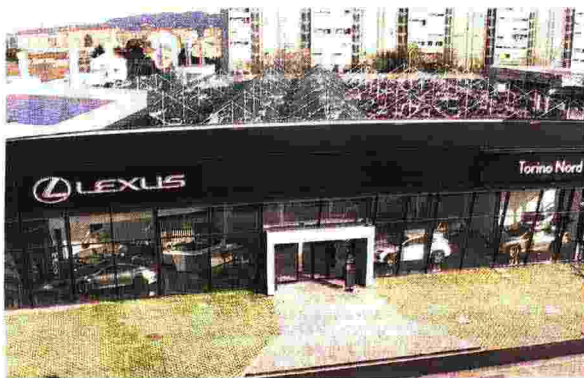
Il nuovo punto vendita Lexus del Gruppo Spazio